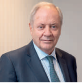
Santiago de Torres